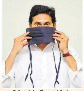
మెప్పా అధ్యక్షులలో ద్వారా మహిళలు తయారు చేసిన మాస్కును పరిశీలిస్తున్న సీఎం