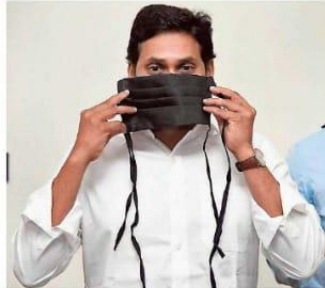
Safety message: Chief Minister Y.S. Jagan Mohan Reddy wearing a mask made by women of DWCR groups, during a review meeting on COVID-19 on Sunday.

The CM further asked the officials to initiate steps to provide insurance to the ward / village volunteers, ASHA and sanitary workers.