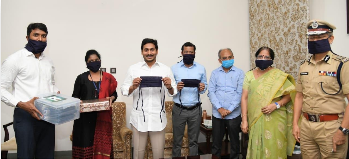
Hon'ble Chief Minister Sri YS Jaganmohan Reddy launched masks Distribution program at CM Camp office.